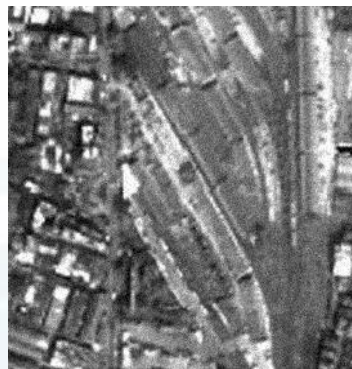
含噪声的绿光波段图像