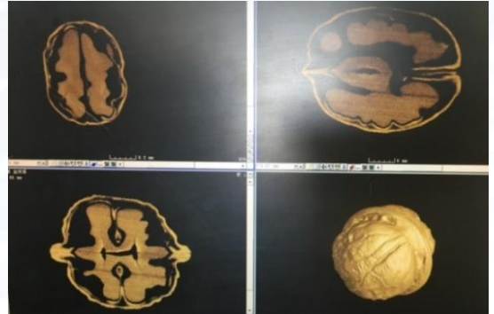
CT重建核桃内部的断层图像